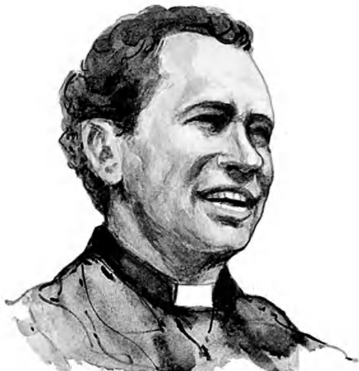
Camilo Torres Restrepo 1929-1966

“El deber de todo Cristiano es ser revolucionario, y el del revolucionario hacer la revolución”