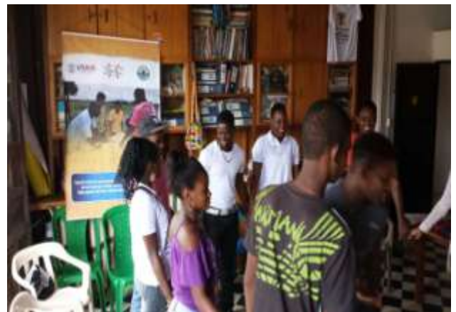
Taller de caracterización de riesgo con jóvenes

Esta iniciativa la venimos trabajando con 9 organizaciones de víctimas que avanzan en la construcción de una agenda común para incidir en el reconocimiento de sus organizaciones y de sus propuestas influyendo ante las autoridades locales.