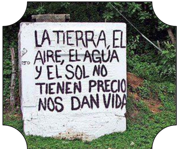
El dinero ya no tendrá una función omnipotente

5. La dotación parcelaria podrá ser heredada sólo por entero a otra familia, no pudiendo fraccionarse en minifundios. SÍ ó NO