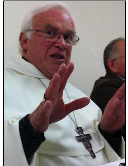
El obispo de Saltillo Raúl Vera anuncia un nuevo México

Convencidas y convencidos en la urgencia de una nueva organización de nuestra patria, fundada en la fuerza de la justicia y el derecho, y en el impulso suave del amor y la compasión hacia nuestras hermanas y hermanos que están sufriendo, el próximo 5 de febrero de 2015 en la