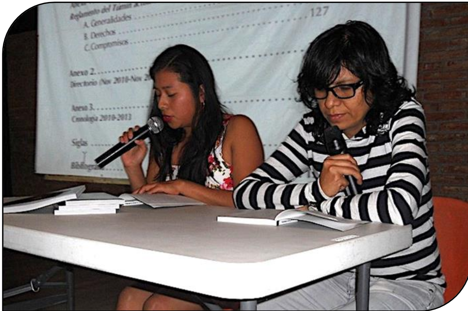
"Empujados por la fuerza de los símbolos..."

■ SE PRESENTÓ EN PAPANTLA EL LIBRO "ACEPTAMOS TÚMIN"