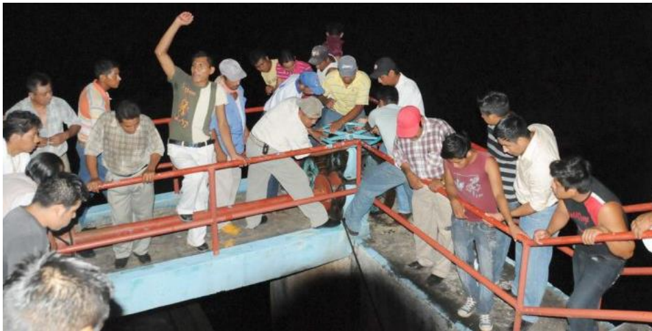
Presa del río Yuribia Como en otras partes del país, los pobladores negocian proyectos y dinero a cambio de sus recursos naturales 1

■ EL PUEBLO ESTÁ ENCABRONADO: CENTRO DE DH "BETY CARIÑO" ■ ANTORCHA CAMPESINA Y PRD NEGOCIAN RECURSOS