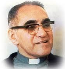
Mons. Oscar Romero