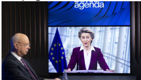
Ursula von der Leyen Presidenta de la Comisión Europea